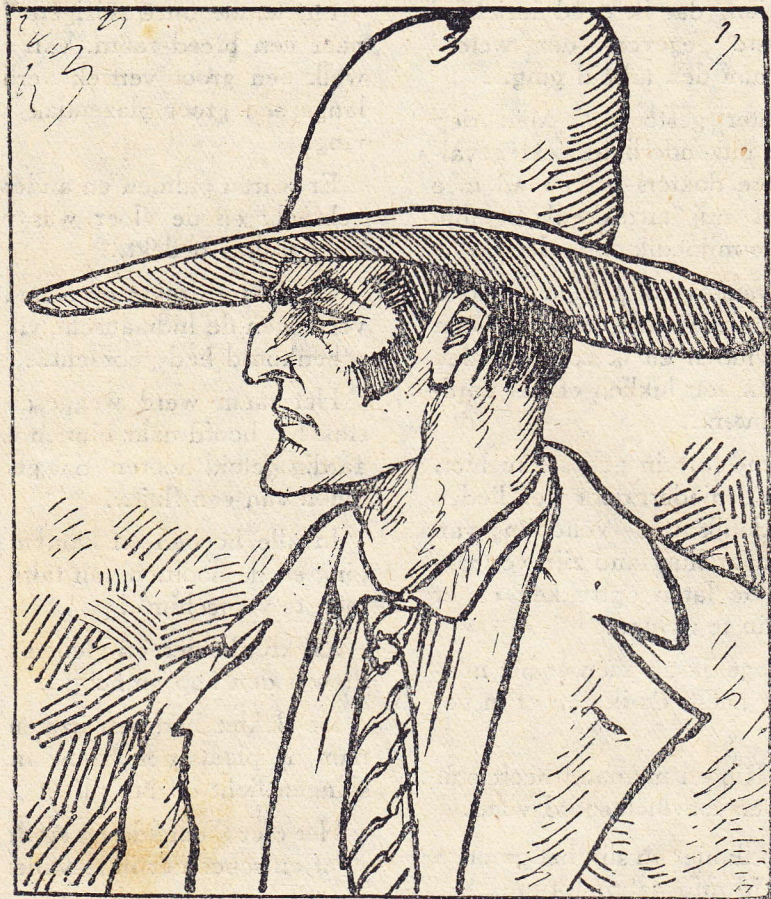
Calchas de Real

Mijn teergeliefde vrouw werd krank en ik stelde met schrik en zielesmart vast dat haar jeugdig lichaam door de ergste kwaal die het menschdom teistert, door kanker was aange-tast.